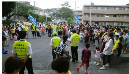
昨年の100人パトロールの様子です